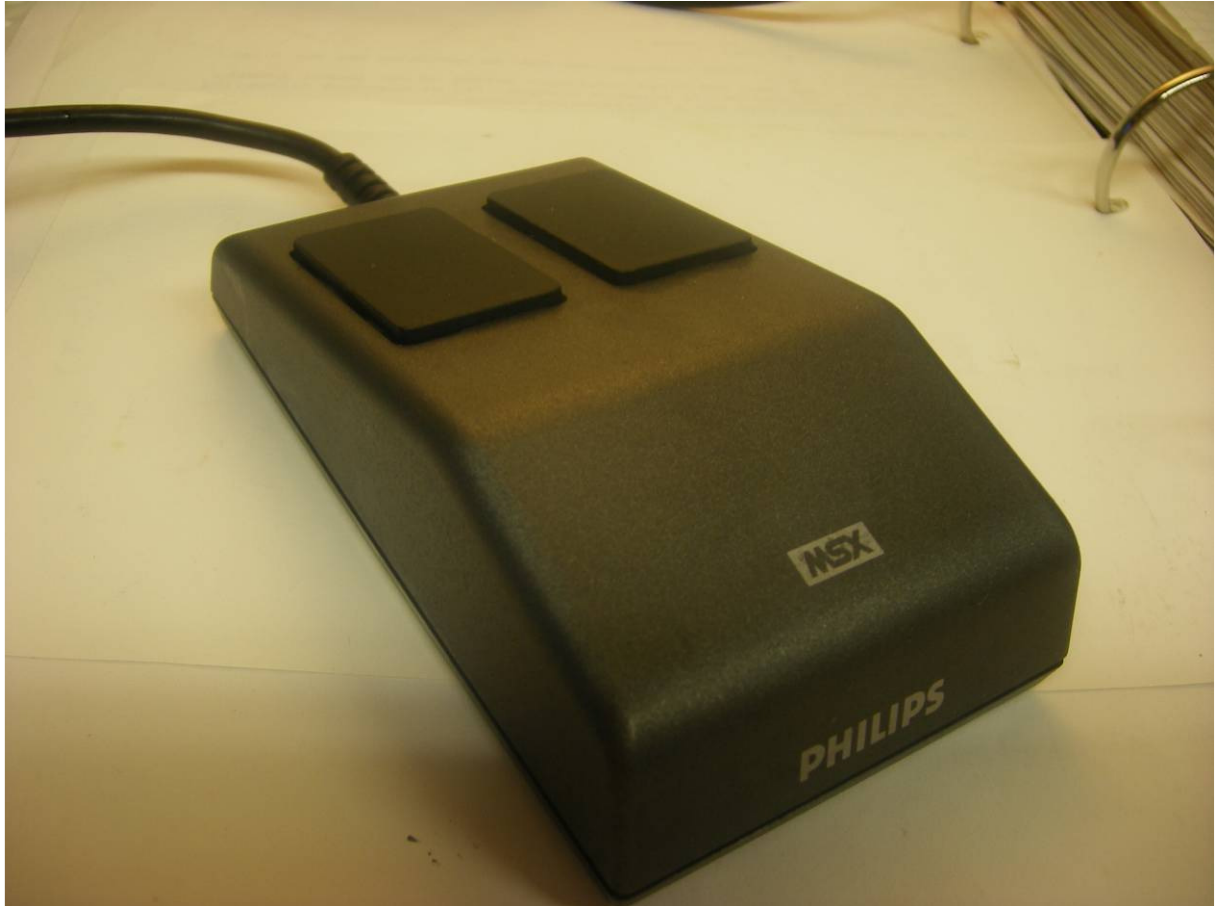
De Philips NMS 1140 muis

Regelmatig komt het voor dat de muis niet meer werkt. In de meeste gevallen is het schoonmaken van de geleidewieltjes de oplossing. Maar een kabelbreuk komt ook regelmatig voor, echter de originele kabels zijn niet meer te verkrijgen. In plaats van de originele kabel kun je ook een joystick-kabel nemen met 9 aders. Neem bijvoorbeeld een oude Quickshot, Crackshot of Spectravideo-Joystick en kijk eerst of deze goed werkt. Haal deze kabel voorzichtig uit de Joystick. De “nieuwe” kabel is niet voorzien van juiste connector, maar kan eenvoudig gesoldeerd worden op de pinnen van de muis-connector.